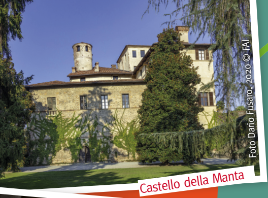
Castello della Manta