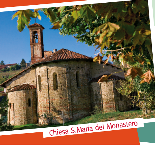
Chiesa S. Maria del Monastero