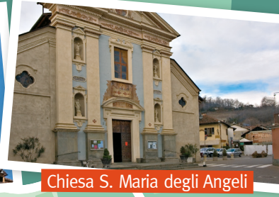
Chiesa S. Maria degli Angeli