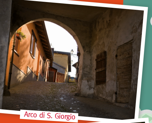
Arco di S. Giorgio