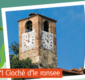
'l Cioché d'le ronsee